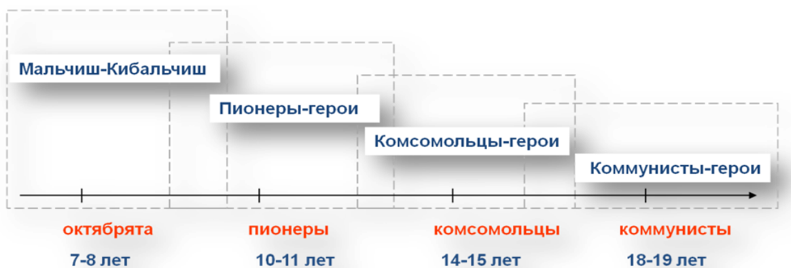
Схема 1. Основные объекты советской модели патриотического воспитания.

Естественно, что помимо «героев», существовала целая система поддержания и закрепления необходимых ценностей и моделей поведения, основанных на них, где основную роль играли средства массовой информации.